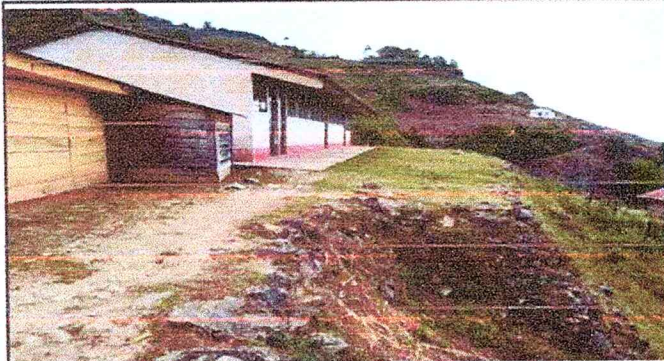
FOTO 1. SE NECESITA CIRCULAR EL PRERIO DE LA ESCUELA