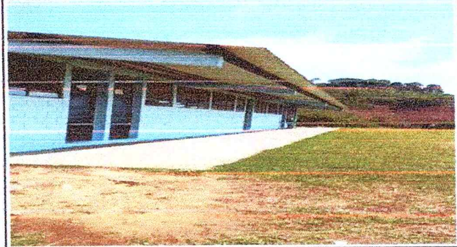
FOTO 2. REPARACION DE MURO PERIMETRAL