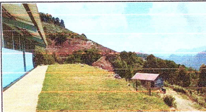
FOTO 3. REPARACION DE MURO PERIMETRAL