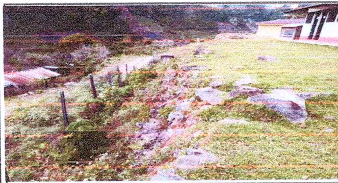
FOTO 5. SUSTITUCION DE MURO PERIMETRAL